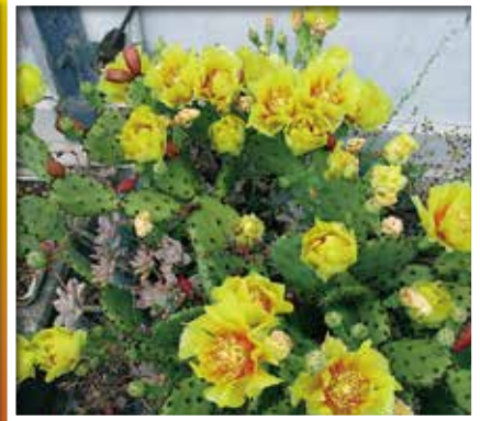
事務所の裏で咲いているサボテンの花