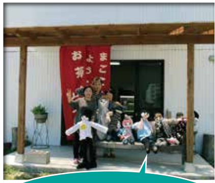
まごころハウス利用者が心をこめて制作したかかし達です。雨にもまけず、風にもまけず、見守りしています！

発行所 まごころケアサービス 高松センター 〒761-8052 高松市松並町802番地1 TEL 087-865-8001 FAX 087-865-8039 E-mail magokoro@hyper.ocn.ne.jp URL http://cho-jyu.info/ 印刷所 株式会社成光社 〒760-0065 香川県高松市朝日町5-14-2 TEL/087-823-0222